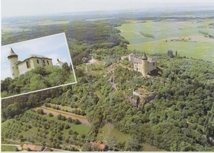
Hrad na Kunčické hoře / Die Burg auf dem Berg Kunčická hora / Castle on near Mount Kunčická